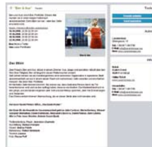
Evento / Veranstaltung