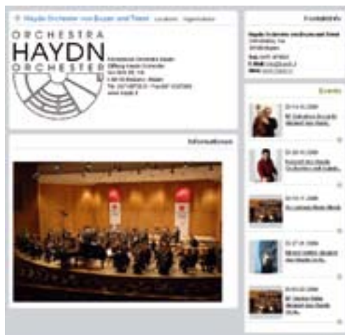
Profil / Profilo